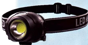
LEDヘッドライト （電池は付属していません）